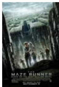
Poster für den Film The Maze Runner 1

Im Jahr 2014 kam der Film „The Maze runner – Die Auserwählten im Labyrinth“ in die Kinos und ist seit einiger Zeit als DVD erhältlich. Dieser Film ist der erste Teil einer Trilogie, die auf einer Jugendbuchserie basiert. Eine Gruppe von Jugendlichen ist in einem riesigen Labyrinth eingeschlossen, aus dem es keinen Ausweg zu geben scheint, da sich einerseits die Wände jede Nacht verschieben und zweitens nach Anbruch der Dunkelheit menschenfressende Wesen den Aufenthalt in den Gängen des Labyrinths lebensgefährlich machen. Die Helden der Handlung sind der 16-jährige Thomas und das Mädchen There-