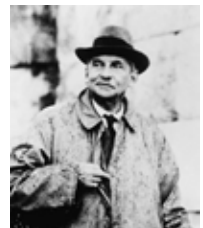
Sir Arthur John Evans 3

Bereits als Junge war Evans von den Sagen der griechischen Antike fasziniert. Die Geschichte von Theseus hatte es ihm besonders angetan.