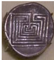
Kretische Silbermünze mit dem „klassischen“ Labyrinth-Muster, 400 v. Chr. 2

Dies ist die Geschichte eines Prinzen namens Theseus und einer Prinzessin Ariadne, die ein Ungeheuer besiegen. Die Sage von Theseus soll hier nur kurz erwähnt werden, da sie als allgemein bekannt vorausgesetzt werden kann. Auf Kreta lebte einst König Minos, Sohn des Zeus und der Europa, der unter seinem Palast von Daedalus und Ikarus ein Labyrinth bauen lies. In diesem Labyrinth