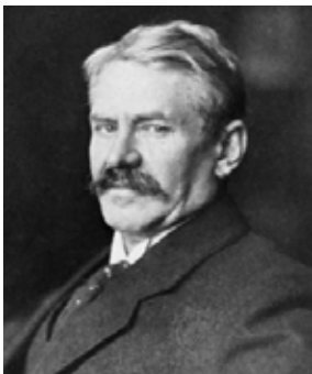
Ernst Troeltsch (1865-1923)

Kritik bedeutet: Alle historische Überlieferung, auch die biblische, muss mit der menschlichen Vernunft kritisch auf ihren Wahrheitsgehalt untersucht werden. Dann stellt sich heraus, was man als eher wahrscheinlich akzeptieren kann und was man als unhistorisch verwerfen muss. Analogie bedeutet: Nur das kann als historisch geschehen betrachtet werden, was auch heute noch vor unseren Augen geschieht. (Damit fallen Wunder wie Jungfrauengeburt, Auferstehung usw. unter Märchen und Legenden.) Korrelation heißt: Alles irdische Geschehen steht in einer Wechselwirkung, das heißt jedes Geschehen leitet sich aus einem anderen ab. Es besteht ein lückenloser Kausalnexus. Damit ist für Troeltsch ein unmittelbares Eingreifen Gottes oder eines Engels in die Weltgeschichte oder auch eine prophetische Vorhersage eines Ereignisses, das erst 500 Jahre später eintritt, undenkbar. 3 Troeltsch steht hier ganz in der Tradition von Aufklärung und Rationalismus, die nicht glauben mochten, dass Gott ein heute noch redender und handelnder Gott ist, und die alle wissenschaftliche Forschung unter der Prämisse „etsi Deus non daretur“ (als ob es Gott nicht gäbe) treiben wollten. Dabei muss immer wieder betont werden, dass es gar keine zwingenden Gründe gibt, Forschung unter dieser atheistischen Vo-